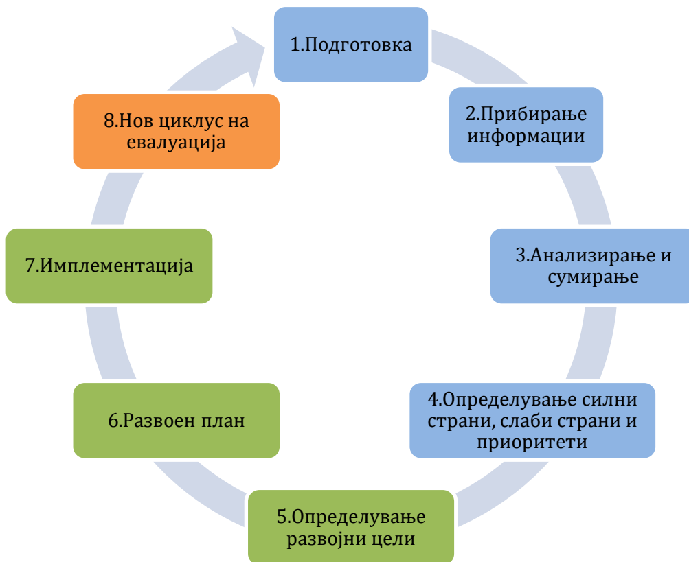
Слика 3. Циклус на проверка и обезбедување квалитет во училиштето

Процесот на самоевалуација се одвива низ четири фази: (1) подготовка, (2) собирање податоци, (3) анализа на податоците и (4) пишување извештај.